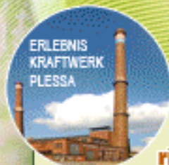
ERLEBNIS KRAFTWERK PLESSA